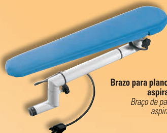
Brazo para planchar aspirante Braço de passar aspirante